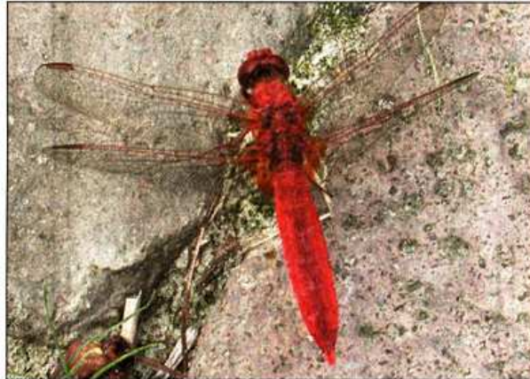
Vuurlibel in de Hortus in Haren.

"Ja, toen lukte het alleen niet om mooie foto's te maken. Nu